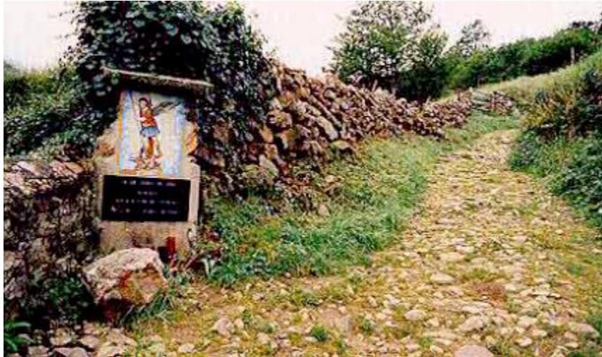
Lugar de la primera Aparición del Ángel.

In order to visit this unusual village, on January 17, 1971, X travelled to Garabandal. He went around the small village and then asked if they celebrated Holy Mass in the village; he received an affirmative answer. After attending the celebration, on the way out he encountered (coincidence, providence?) the owner of the car from Reinosa, with whom he conversed. He began the ascent toward the Pines, stopping in the place where the angel had appeared to pray.